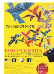
第7回大会 平成19年度