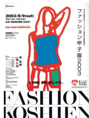
第3回大会 平成15年度