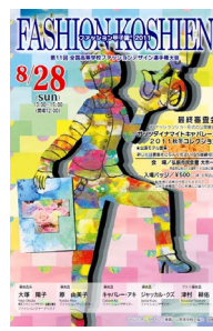
第11回大会 平成23年度 青森戸山高校 福士胡桃