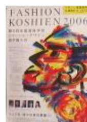
第6回大会 平成18年度