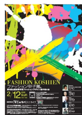
第5回大会 平成17年度