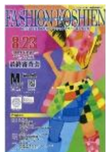
第15回大会 平成27年度 黒石商業高校 今井敦也