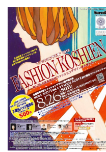
第12回大会 平成24年度 弘前実業高校 成田知恵