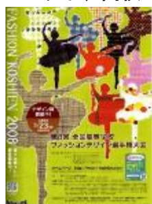
第8回大会 平成20年度 黒石商業高校 木村知里