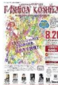
第16回大会 平成28年度 鯉ヶ沢高校 加藤星南