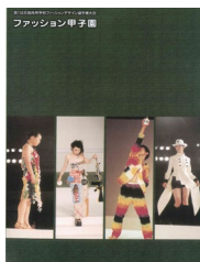
第1回大会 平成13年度