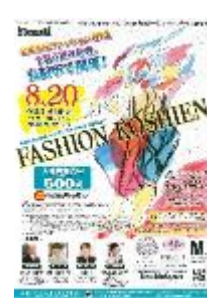
第17回大会 平成29年度 興陽高校(岡山県) 井上賀由里